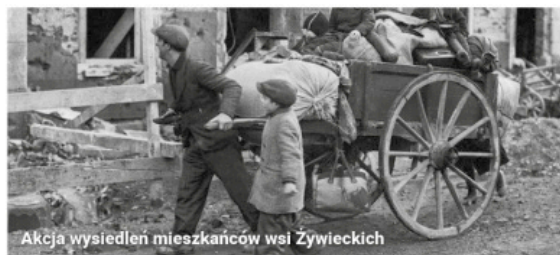
Akcja wysiedlenia mieszkańców wsi Żywieckich