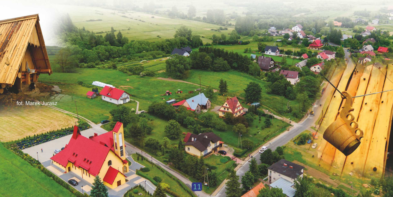
fol. Marek Jurasz

M iejscowość letniskowa, do której co roku przyjeżdżają turyści, aby niebieskim szlakiem wędrować na Halę Radziechowską prowadzącą na Baranią Górę. W trakcie wycieczek podziwiać można piękne, górskie widoki. Od niedawna organizowany jest tutaj co roku REDYK w przepięknym gospodarstwie wiejskim wraz z bacówką.