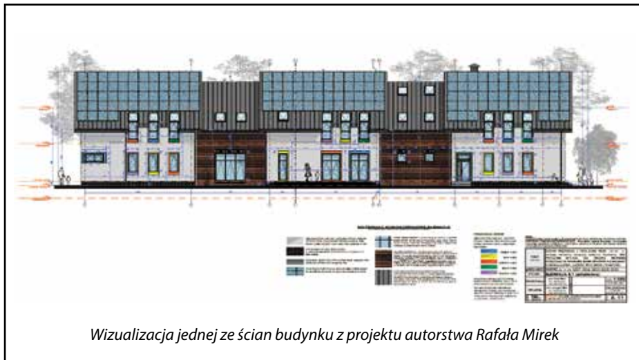
Wizualizacja jednej ze ścian budynku z projektu autorstwa Rafała Mirek