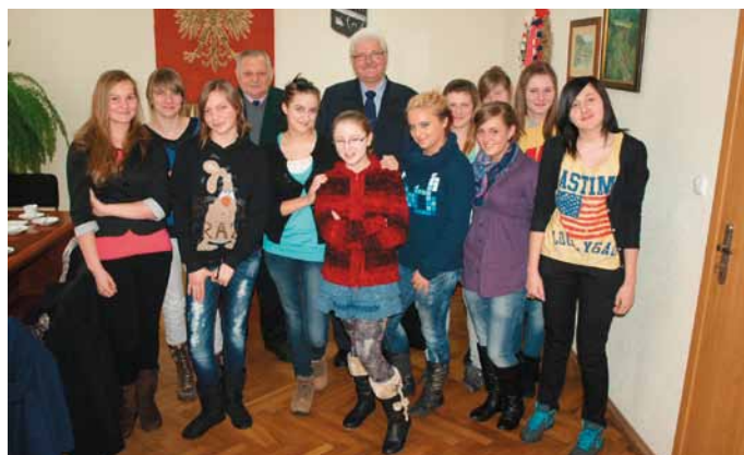
Szcypiornistki złożyły niedawno wizytę władzom gminy Radziechowy-Wieprz.

O tym, jak wyglądają mecze i treningi, a przede wszystkim wyniki dziewcząt, można się dowiedzieć ze stron internetowych: www.recznawieprz.bnx.pl , www.reczna-wieprz.blog.onet.pl