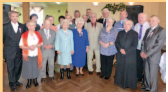
Jubilaci z Wieprza