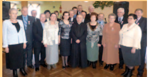
Jubilaci z Juszczyzny

Po mszy świętej, Złoci Jubilaci udali się do Budynku Kulturalna – Oświatowego w Brzuśniku, gdzie nastąpiło uroczyste wręczenie medali, które na mocy Ustawy z dnia 16 października 1992 r., zostały przyznane przez najważniejszą osobę w naszym państwie – Prezydenta Rzeczypospolitej Polskiej. Medal ten jest formą uznania Jubilatów, za to, że uczynili kogoś ważnym w swoim życiu i nie zawiedli go. Stali się solą tej ziemi, broniąc wartości rodziny przed rozpadem, chaosem, indywidualizmem. Czyniąc swoje małżeństwo pięknym i trwałym, przez co dobrze przysłużyli się Polsce i światu.