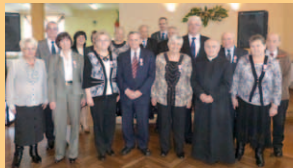
Jubilaci z Radziechów i Przybędza