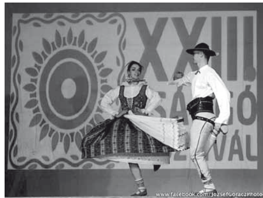
XXIII. Csángó Fesztivál 2013. JÁSZBERÉNY