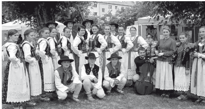
Budapeszt - XIII dzielnica - Angyalföld - świętuje 75-lecie

6 lipca na obiekcie okołoturystycznym w Wieprzu odbył się po