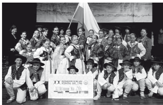
„Mali Grojcowianie” w Gorzowie Wielkopolskim