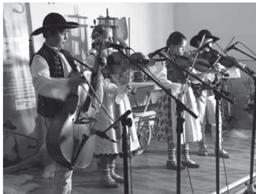
Dziecięca kapela „Mali Grojcowianie” I miejsce

Zespół Regionalny „Grojcowianie” z Wieprza reprezentował POLSKĘ na XXIII. Csángó Fesztivál 2013. augusztus 6-11. JÁSZBERÉNY na Węgrzech. Do tego tradycyjnego Festiwalu promującego autentyczny folklor węgierski ale i innych krajów świata wytypowała nas Międzynarodowa Rada Stowarzyszeń Folklorystycznych, Festiwalu i Sztuki Ludowej CIOFF której jesteśmy członkiem. Na Festiwal mogliśmy pojechać również dzięki wsparciu uzyskanemu w konkursie na realizację zadań publicznych w zakresie przeciwdziałania i patolo-