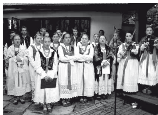
Pielgrzymowanie do Rychwałdu