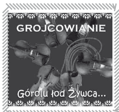
Nowa płyta CD