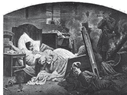
Po odejściu wroga