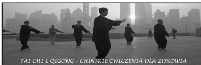
TAI CHI I QIGONG - CHIŃSKIE ĆWICZENIA DLA ZDROWIA

Grupa nieformalna "Misski spod Matyski" zaprasza wszystkie Panie na spotkanie w ramach projektu "Kopernik też była kobietą"