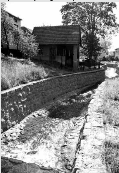
Radziechowy potok Wieśnik RZGW