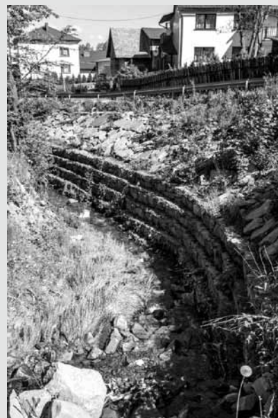
Brzuśnik „Lewy Groń”