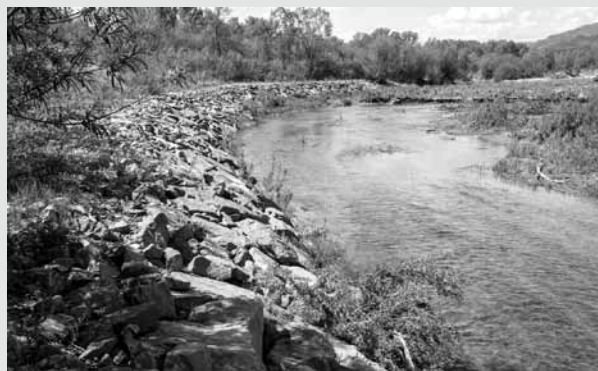
Wieprz „Soła” ujęcie wody RZGW