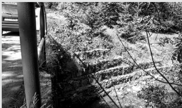
Bystra „Za Wodą”

W imieniu mieszkańców dziękujemy Regionalnemu Zarządowi Gospodarki Wodnej w Krakowie i pracownikom Wydziału Zarządzania Kryzysowego w Urzędzie Wojewódzkim w Katowicach za wszelką pomoc włożoną w zabezpieczenie rzeki Soły i potoków. Dziękujemy także wszystkim Strażakom, którzy wzięli udział w walce z żywiołem za czuwanie nad naszym bezpieczeństwem.