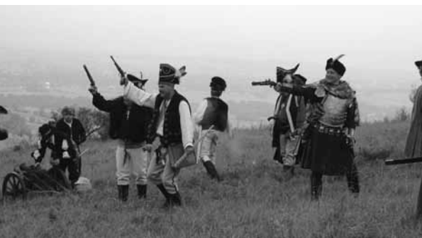
Polska Szlachta odpięra atak wojsk szwedzkich

Każdorazowo na tej uroczystości, przy wtórze werbla odczytywany jest Apel Poległych. Podniosłość chwili podkreśla obecność: