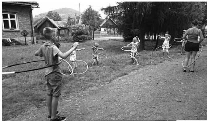
Fotorelacja z Wieprza