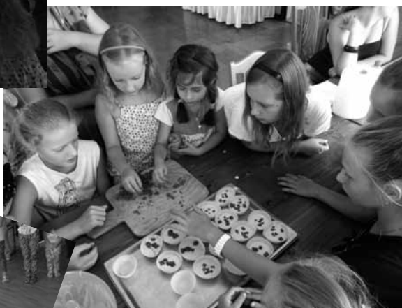
Fotorelacja z Bystrej