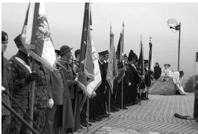
Udział pocztów sztandarowych