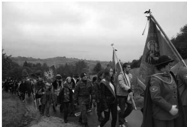
Kolumna marszowa na trasie

• W 2013 r. oddaliśmy hołd Powstańcom Styczniowym w 150 rocznicę Tego powstańczego zrywu.