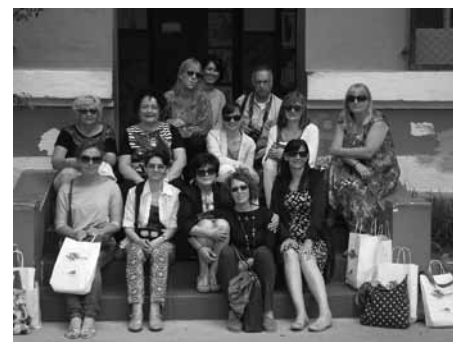
5-10.05.2015 r. Hiszpania, La Linea de la Concepcion