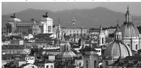
Od 08.06.2015 r. ponad 50 uczniów naszego Gimnazjum uczestniczy w projekcie realizowanym na terenie Włoch.