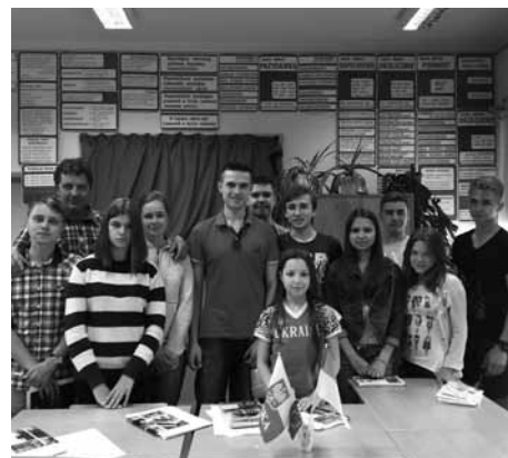
06.-13.06.2015 r. Warsztaty kultury polskiej i języka polskiego jako obcego; młodzież z polskiej szkoły w Charkowie.