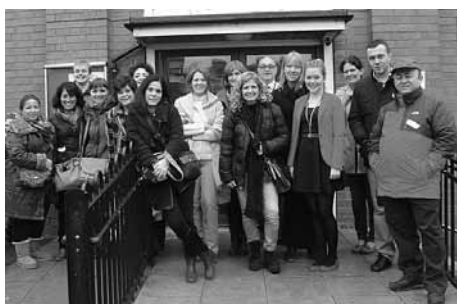
19-21.11.2014 r. Wielka Brytania, Malvern

Realizacja projektu: Erasmus + „Connecting Pupils to the European Space”.