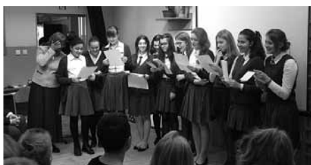
15-24.2014 r. – Międzynarodowy Projekt Przyrodniczo-Językowy realizowany w Nowosybirsku oraz 17-26.06. 2015 r. w górach Autaj – azjatycka część Rosji.