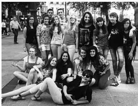
30.09-06.10.2015 r. „La Mancha – Spotkanie Trzech Kultur” polsko – hiszpańska wymiana młodzieży w Torrijos