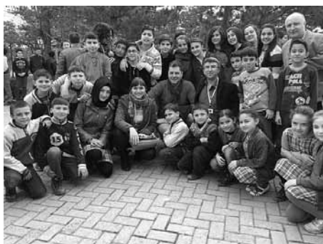
3-7.03. 2015 r. Turcja, Kütahya