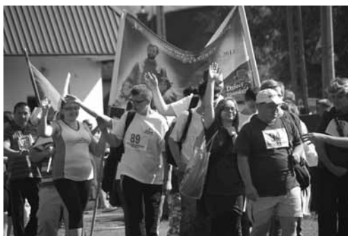
XV Paraolimpiada w Wieprzy ileż to niezapomnianych chwil.

ra i światło z Żywca, dzięki czemu mogli pozyskać pieniądze na turnus rehabilitacyjny b) osobie po wypadku umożliwiające zabiegi rehabilitacyjne w domu i zakup sprzętu rehabilitacyjnego c) dwóm osobom po wylewie umożliwiając rehabilitację, w tym turnus d) dwójce dzieci; jednemu opłatę operacji za granicą, drugiemu rehabilitację