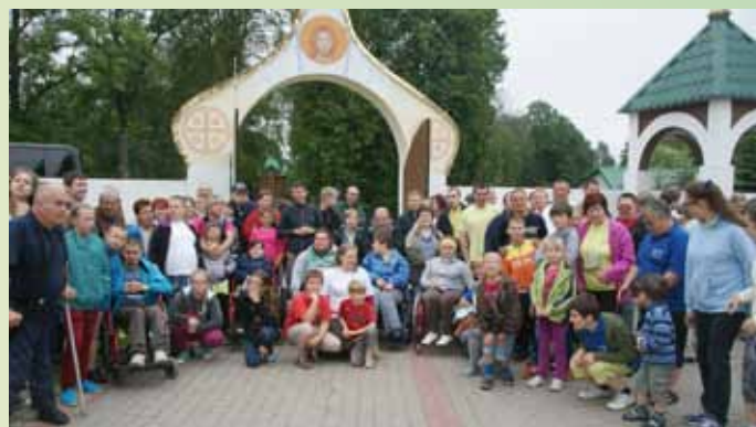
Zwiedzamy Cerkiew Prawosławną w Jablonce