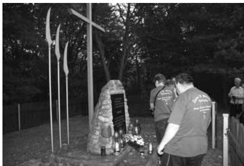
Przy Mogile Powstańców Styczniowych w Hannie

szego Patrona O. Michała Tomaszka z Jego rodzinnego domu do kościoła.