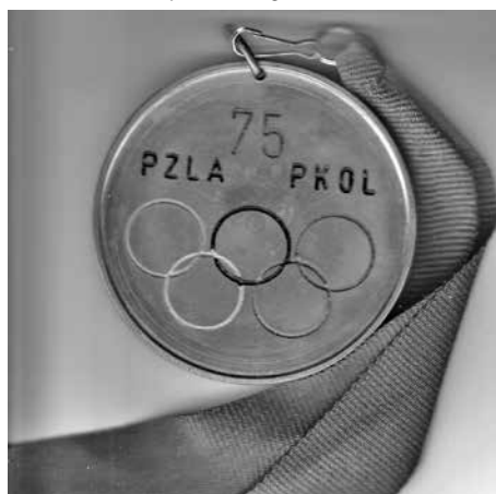
Medal 75-lecia PKOL i PZLA