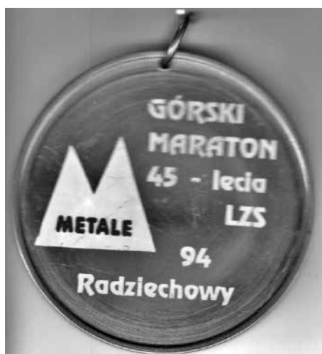
Pierwszy maraton górski w Polsce