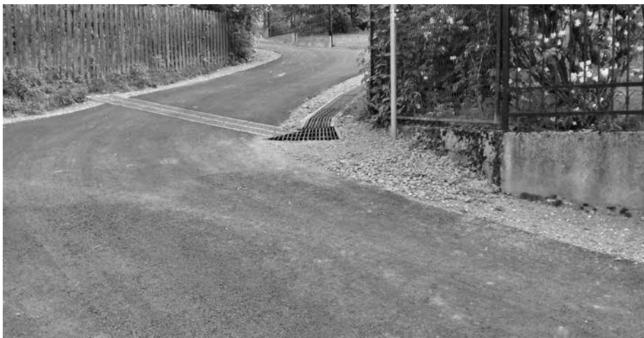
Nowa odnoga drogi do Bugaja

5) Odnoga ul. Modrzewiowej, dz. nr 6281 w Radziechowach – 90m – wykonawca robót: PRB DROBUD Sp z o. o.