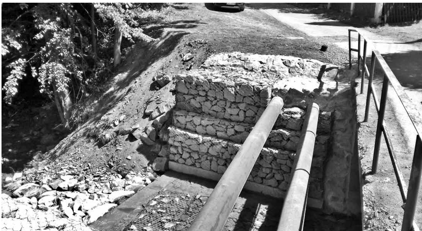
Wyremontowany most w Bystrej