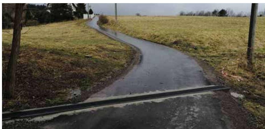
Droga do Kołaczyków Brzusnik