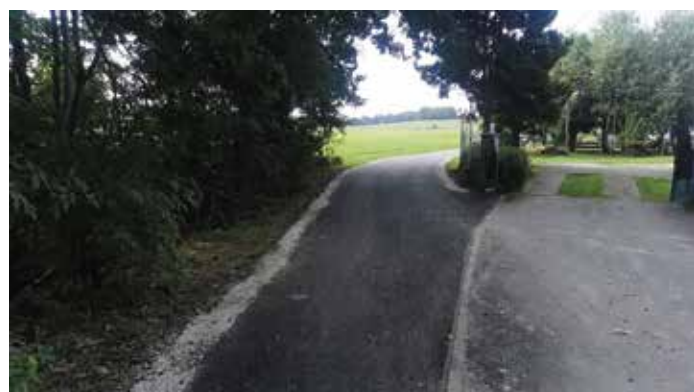
Odnoga ul. Głównej dz. 196, 331 Brzuśnik

Ponadto gmina podpisała umowę na wykonanie zadania pn.: Budowa obiektu mostowego w ciągu ul. Modrzewiowej w m. Przybędza w gminie Radziechowy-Wieprz w formule „Zaprojektuj i wybuduj”. Ponadto Gmina zdobyła pieniądze w kwocie 1 710 000,00 zł na wykonanie zadania pn. „Przebudowa ulic Kamiennej i Wlejskiej w Wieprzu i łącznika ulic Abramska-Zakole-Kwiatowa-Wajdowa w Radziechowach”. Obecnie został już wybrany wykonawca robót - jest nią firma Przedsiębiorstwo Robót Budowlanych Drobud Sp. z o.o. z Żywca.