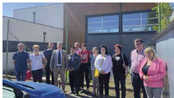
Sala gimnastyczna w Przybędzy