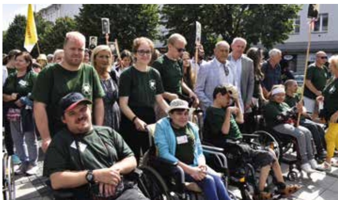
Pielgrzymka do Częstochowy