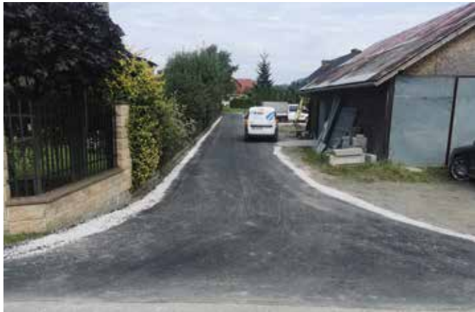
Odnoga ulicy Długiej w Wieprzu