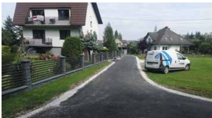
Odnoga ulicy Wierzbowa w Wieprzu

Informujemy także, że prawie ukończona jest przebudowa drogi do gruntów rolnych w ramach zadania „I część modernizacji drogi dojazdowej do gruntów rolnych Wieprz–Juszczyna w na odcinku km 0+000-0+995 w miejscowości Wieprz (dz. ewid. nr 2646, 2553”).