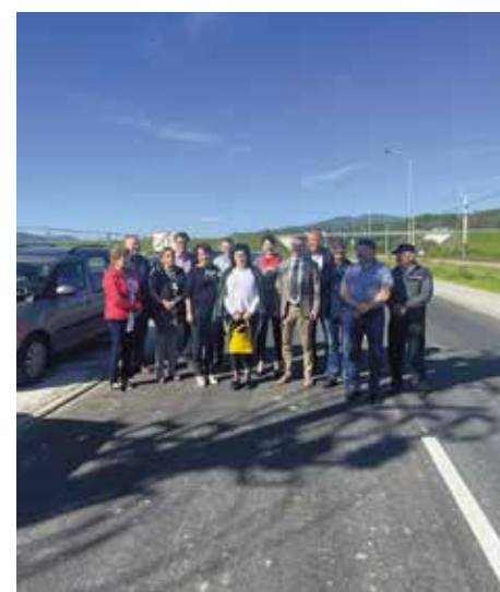
Ukończona droga w Katowickiej Specjalnej Strefie Ekonomicznej w Wieprzu