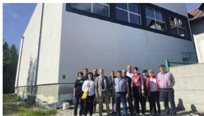
Sala gimnastyczna w Bystrej