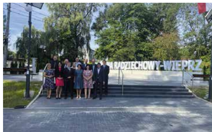
Nowy plac przy Urzędzie Gminy