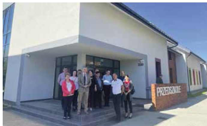
Przedszkole w Wieprzu