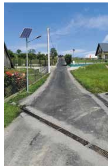
Droga do Świniańskich Juszczyna

Ponadto gmina podpisała umowę na wykonanie zadania pn.: Budowa obiektu mostowego w ciągu ul. Modrzewiowej w m. Przybędza w gminie Radziechowy-Wieprz w formule „Zaprojektuj i wybuduj”. Ponadto Gmina zdobyła pieniądze w kwocie 1 710 000,00 zł na wykonanie zadania pn. „Przebudowa ulic Kamiennej i Wlejskiej w Wieprzu i łącznika ulic Abramska-Zakole-Kwiatowa-Wajdowa w Radziechowach”. Obecnie został już wybrany wykonawca robót - jest nią firma Przedsiębiorstwo Robót Budowlanych Drobud Sp. z o.o. z Żywca.