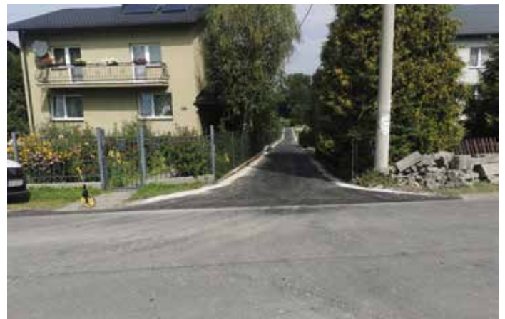
Droga nr 48 Brzuśnik