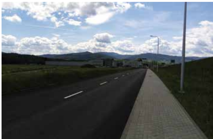
Droga w KSSE