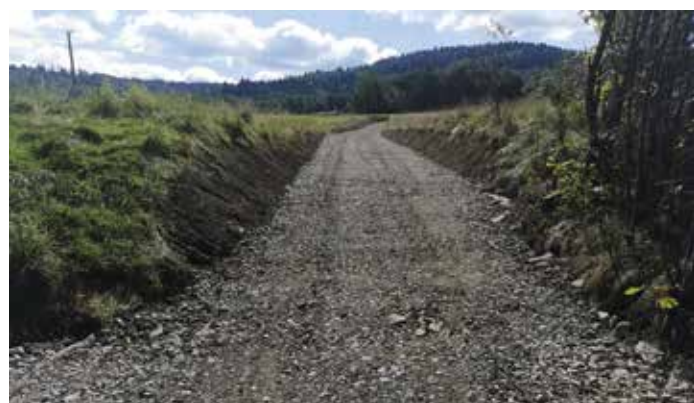
Ul. obok Kapliczki Juszczyna