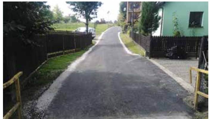
Droga dz. 252 Brzuśnik