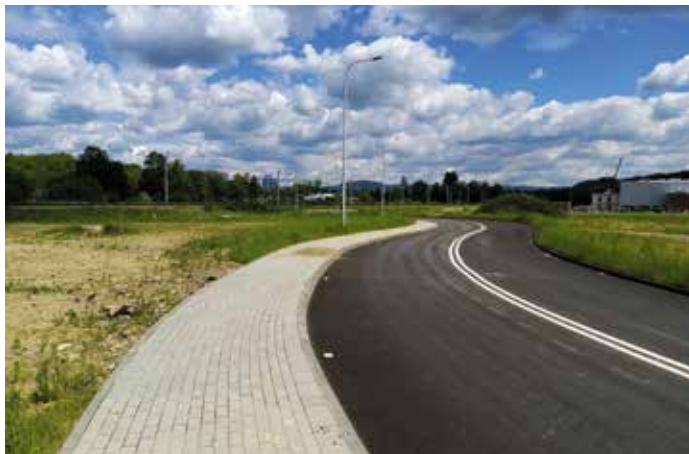
Droga w Katowickiej Specjalnej Strefie Ekonomicznej w Wieprzu