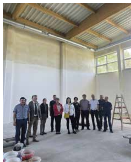
Sala gimnastyczna w Bystrej