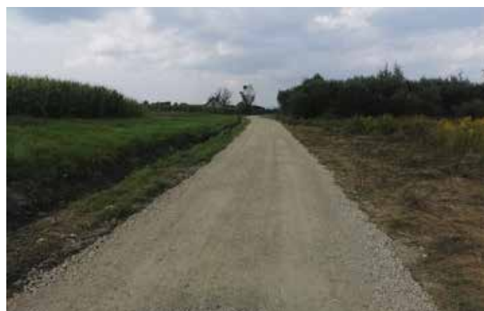
Ul. Młodych Radziechowy