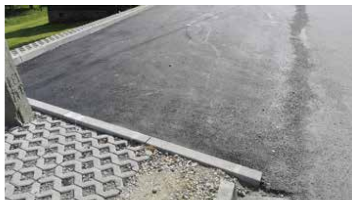
Plac OSP Bystra