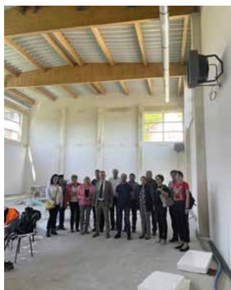
Sala gimnastyczna w Przybędzy