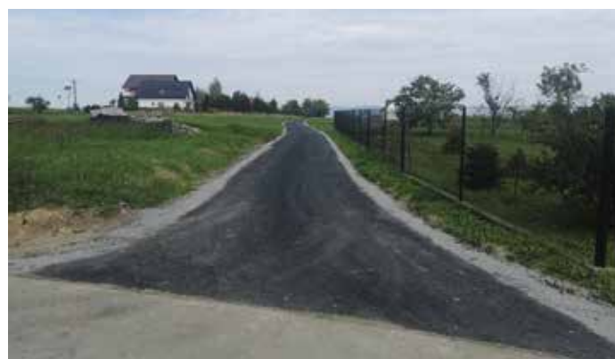
Odnoga ulicy Rożanej Radziechowy