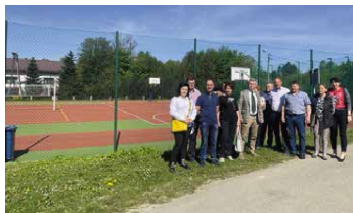
Ukończenie generalnego remontu boiska sportowego przy ZSP w Juszczyńie