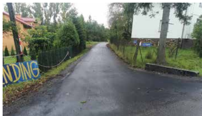
ul Wapienna Przybędza