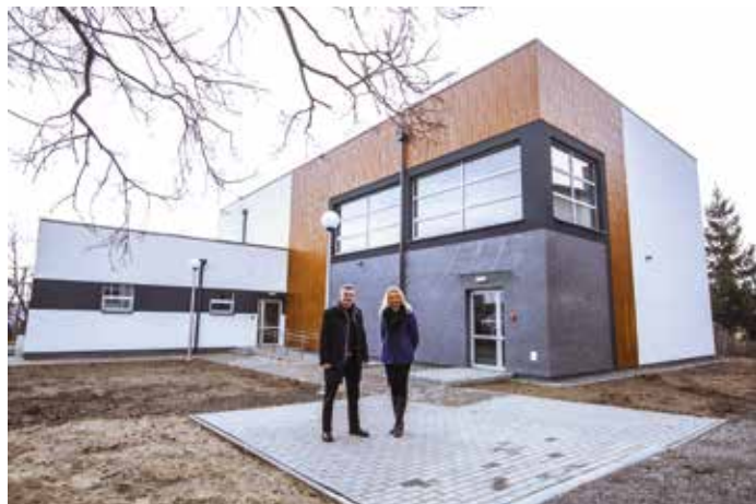
Sala w Przybędzy