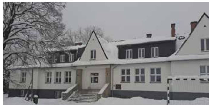
Szkoła w Przybędzy