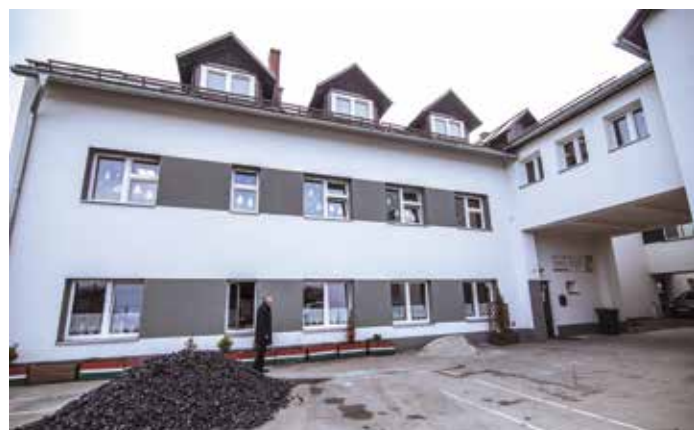
Szkoła w Bystrej