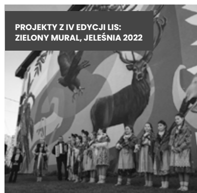
PROJEKTY Z IV EDYCJI LIS: ZIELONY MURAL, JELEŚNIA 2022