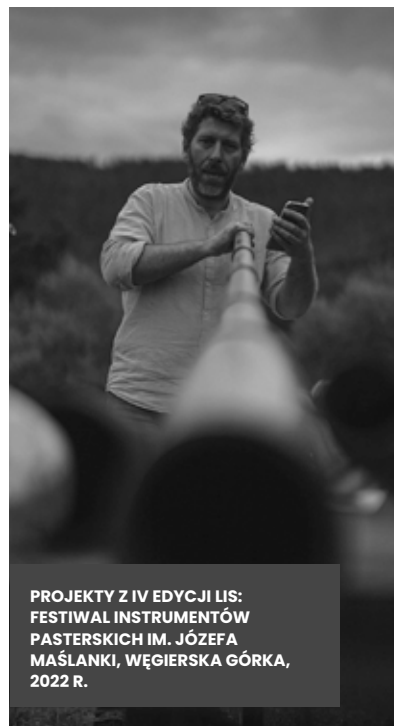
PROJEKTY Z IV EDYCJI LIS: FESTIWAL INSTRUMENTÓW PASTERSKICH IM. JÓZEFA MAŚLANKI, WĘGIERSKA GÓRKA, 2022 R.