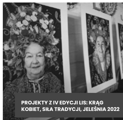
PROJEKTY Z IV EDYCJI LIS: KRĄG KOBIET, SIŁA TRADYCJI, JELEŚNIA 2022

Wszystkie projekty ruszają już końcem marca i potrwać do końca września. Zachęcamy do śledzenia postępów na stronie www.lis-zywiec-zdroj.pl . Szukajcie również LIS-a na facebookowym profilu: facebook.com/LokalneInicjatywySpoleczne .