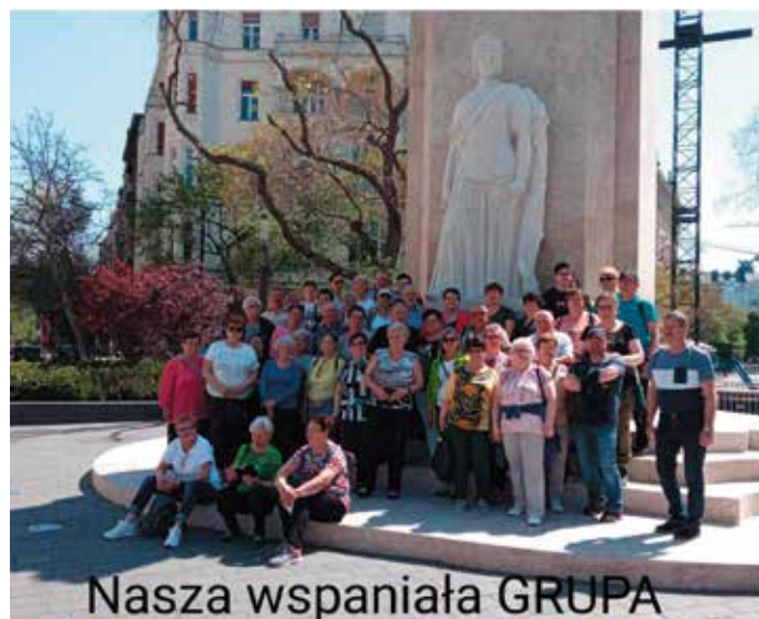
Nasza wspaniała GRUPA