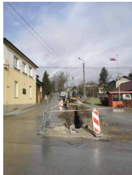
Ul. Szkolna, Radziechowy

Została także przejęta na rzecz Gminy droga od lasu do „Cichej” w Juszczyźnie.