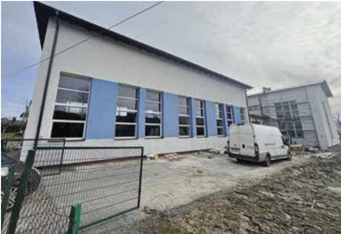
Szkoła w Radziechowach