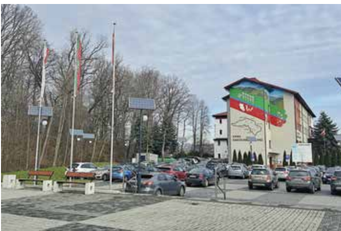
Plac przy Urzędzie Gminy wraz z modernizacją