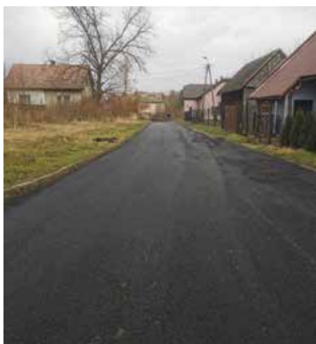
Ul. Modrzewiowa, Radziechowy