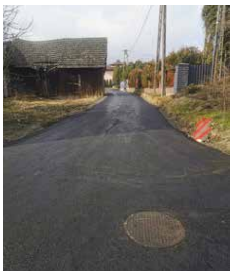
Odnoga ul. Topolowej, Radziechowy