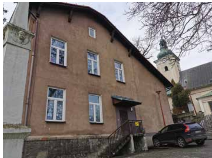
Przedszkole w Radziechowach (ul. Św. Marcina)