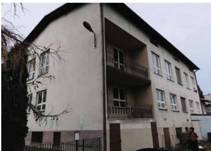
Przedszkole w Radziechowach (ul. Główna)