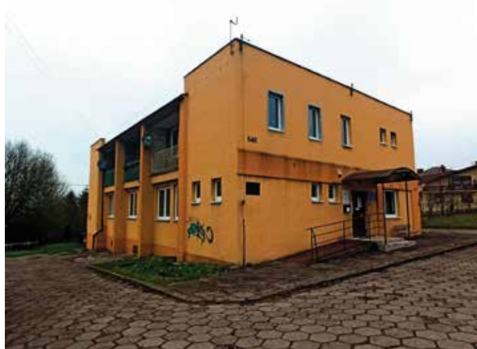
Ośrodek Zdrowia w Wieprzu

chowach – budynek przy ul. Św. Marcina 740.: Przedszkole im. Władysława Pieronka w Radziechowach – budynek przy ul. Głównej 759 oraz Zespół Szkolno-Przedszkolny ul. 3 Maja 71, 34-381 Radziechowy – budynek Przedszkola. Podczas tych zadań wykonane zostanie ocieplenie ścian zewnętrznych, stropów oraz w razie konieczności wymiana stolarki/naprawa stolarki okiennej/drzwiowej, wymiana/modernizacja instalacji c.o. i c.w.u. W Przedszkolu w Radziechowach przy ulicy Św. Marcina zostanie także wykonana wymiana źródła ciepła z kotła węglowego na kocioł na pellet.