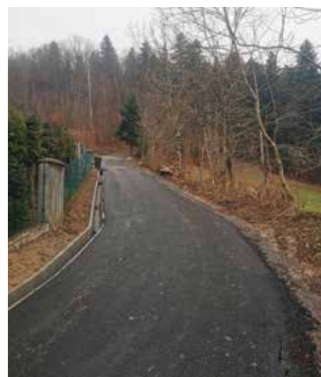
Brzunnik, Prawy Gron