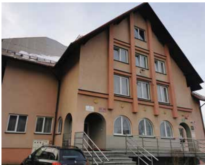
Budynek Wielofunkcyjny w Brzuśniku

Obiektami poddanym pracom termomodernizacyjnym będą trzy przedszkola: Przedszkole im. Władysława Pieronka w Radzie-