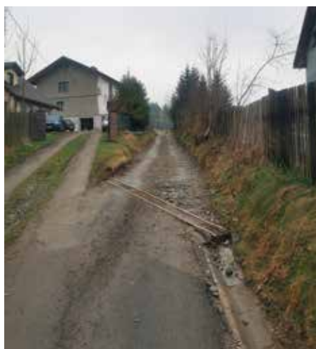
Juszczyzna, Borek 2 w trakcie realizacji