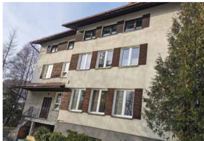
Przedszkole przy ZSP w Przybędzy

Jednocześnie Gmina przygotowuje się do procesu aplikacji o środki zewnętrzne w celu objęcia zadaniem termomodernizacji dodatkowych obiektów. Obecnie tworzona jest dokumentacja na przeprowadzenie zadania na następujących obiektach: Strażnica OSP Wieprz, Dom Ludowy w Wieprzu, Dom Ludowy w Radziechowach, Dom Ludowy w Juszczyźnie oraz Ośrodek Zdrowia Wieprz.