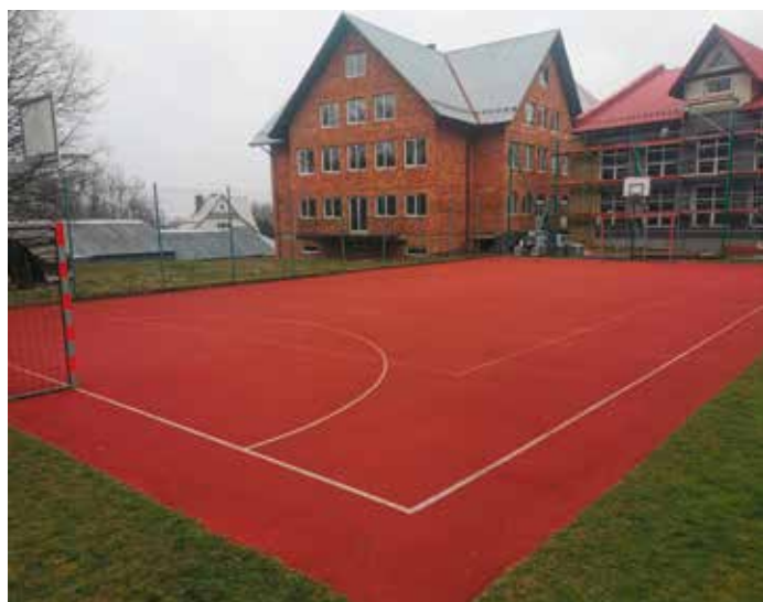
Termomodernizacja szkoły oraz remont boiska w Brzuśniku

W ciągu mijającej kadencji poświęciliśmy szczególnie dużo uwagi kwestii infrastruktury drogowej, zdając sobie sprawę, iż jest to zagadnienie niezwykle ważne dla wszystkich. Pragnę zakomunikować, iż w tym czasie przeznaczaliśmy na inwestycje drogowe blisko 33 miliony złotych (ze środków pozyskanych oraz własnych) przeznaczając do modernizacji prawie 250 odcinków drogowych.