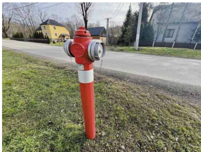
Wodociąg w Juszczyńcu

Mijająca kadencja to również czas realizacji wielu wyczekiwanych od lat przez mieszkańców inwestycji. Wybudowaliśmy nowe przedszkole w Wieprzu, które w opinii wielu jest najnowocześniejsze i najpiękniejsze w powiecie. Część tzw. Okrąglaka w Wieprzu została gruntownie przebudowana. Powstał nowoczesny i estetyczny obiekt Gminnego Centrum Edukacji Ekologicznej, gdzie odbywają się tematyczne warsztaty dla dzieci i młodzieży. W Radziechowach – odpowiadając na zgłaszane wielokrotnie prośby osób starszych – wyposażyliśmy budynek Ośrodka Zdrowia w windę, wykonaliśmy remont schodów zewnętrznych oraz parking za budynkiem. Główna droga przez Radziechowy, od kościoła w górę, została wyposażona w tzw. bezpieczne pobocze, które może być wykorzystywane jako chodnik. Gminna działka poniżej Domu Nauczyciela w Radziechowach została urządzona i zagospodarowana w postaci obiektu sportowo-rekreacyjnego, w skład którego wchodzi m.in. amfiteatr z obiektem małej gastronomii oraz skatepark. Powstał on w odpowiedzi na liczne wnioski mieszkańców dotyczące konieczności zorganizowania miejsca spotkań na lokalne imprezy plenerowe. W 2021 roku wykonaliśmy kompleksową modernizację wielofunkcyjnego boiska sportowego w Juszczyńcu. W Przybędzy i Bystrej wybudowaliśmy sale gimnastyczne, aby tamtejsza młodzież szkolna mogła w godziwych