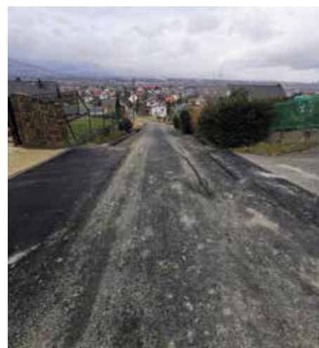
Ul. Miodowa, Wieprz