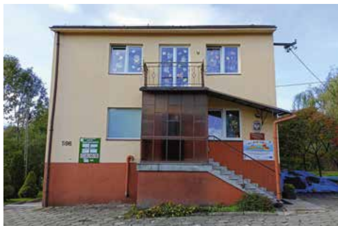
Przedszkole Wieprz ul. Figurów elewacja Frontowa

Kolejnym istotnym etapem jest termomodernizacja fundamentów oraz termomodernizacja ścian zewnętrznych. Odpowiednia izolacja przeciwwilgociowa i przeciwwodna zapobiegnie przenikaniu wilgoci do wnętrza budynku, co będzie miało istotne znaczenie dla utrzymania odpowiednich warunków wewnątrz budynku. Ocieplenie ścian zewnętrznych przyczyni się do zmniejszenia zużycia ener-