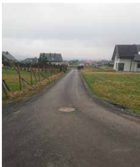
Bystra, droga do Bugaja