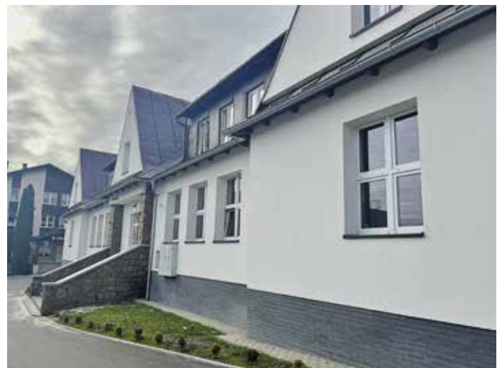
Szkoła w Przybędzy