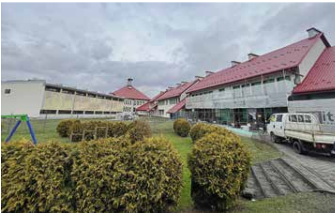
Szkoła w Wieprzu