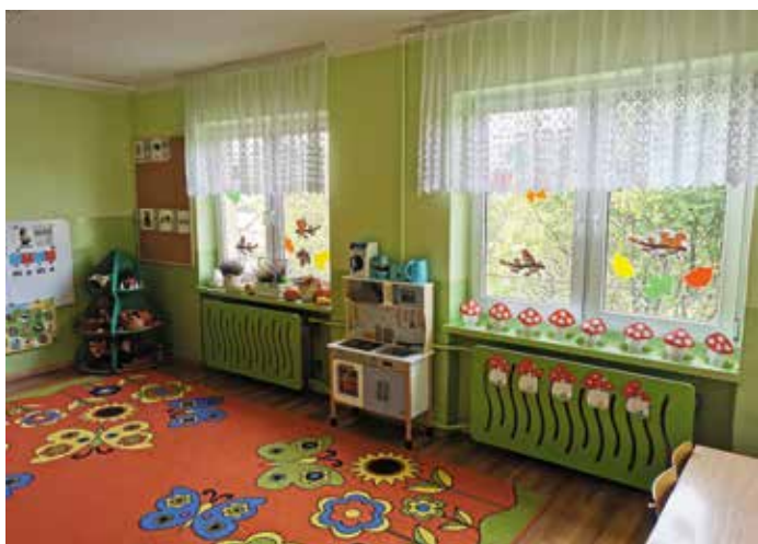
Przedszkole Figurów Wieprz sala zajęć

W zakończonym już postępowaniu przetargowym została wyłoniona firma: Zakład Budowlano-Montażowy PROBUD Przedsiębiorstwo Wielobranżowe Sp. z o.o. ul. Leśnianka 101, 34-300 Żywiec. Przedstawiona przez Wykonawcę cena ofertowa wynosi 581 967,61 zł brutto.