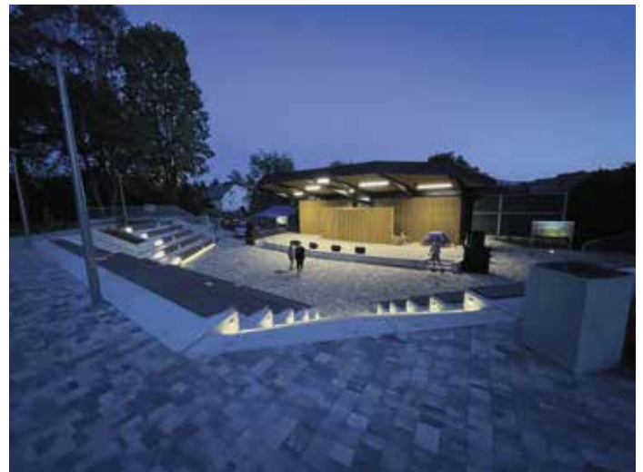
Obiekt sportowo-rekreacyjny w Radziechowach