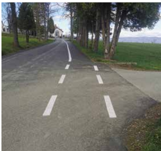
Radziechowy Ul. Plebańska

Liczne inwestycje drogowe prowadzone przez gminę to element rozwoju strategii mającej na celu zwiększenie bezpieczeństwa, komfortu i dostępności dróg dla mieszkańców oraz odwiedzających.