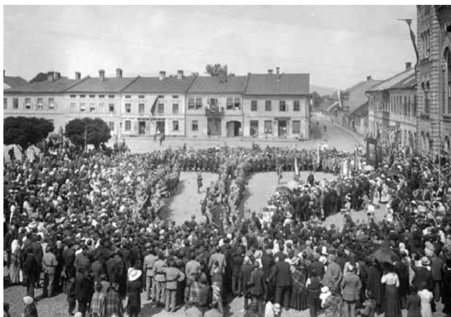
Wymarsz Legionistów z Rynku w Żywcu - 7 sierpnia 1914 r.