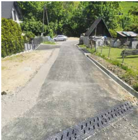
Bystra Droga do Tlalków