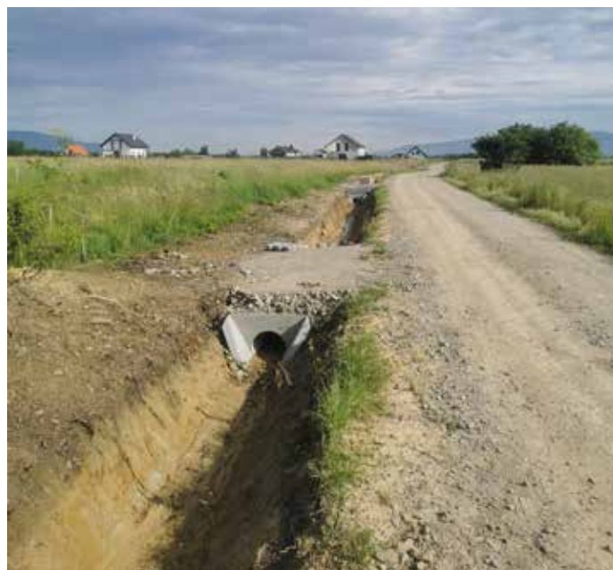
Radziechowy ul. Akacyjowa