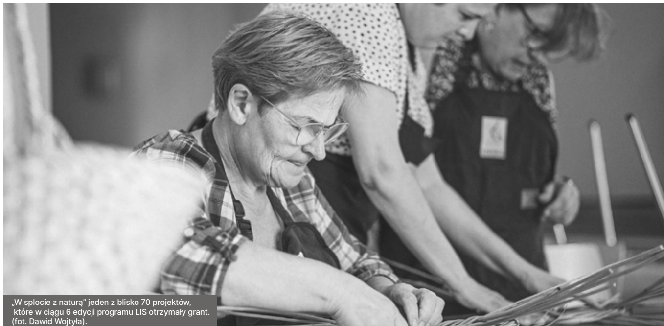
„W splocie z naturą” jeden z blisko 70 projektów, które w ciągu 6 edycji programu LIS otrzymały grant.

Ambitne projekty środowiskowe, troska o zdrowie psychiczne i street art w najlepszym wydaniu.