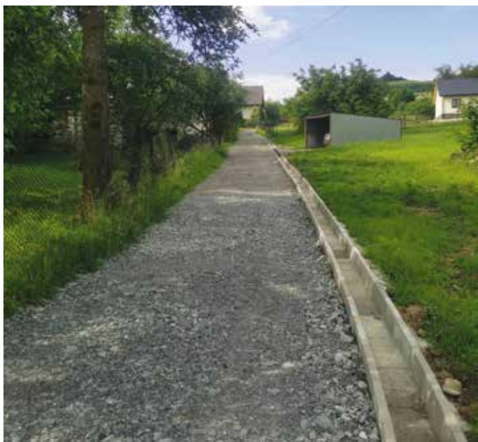
Radziechowy odnoga ul. Michalskich