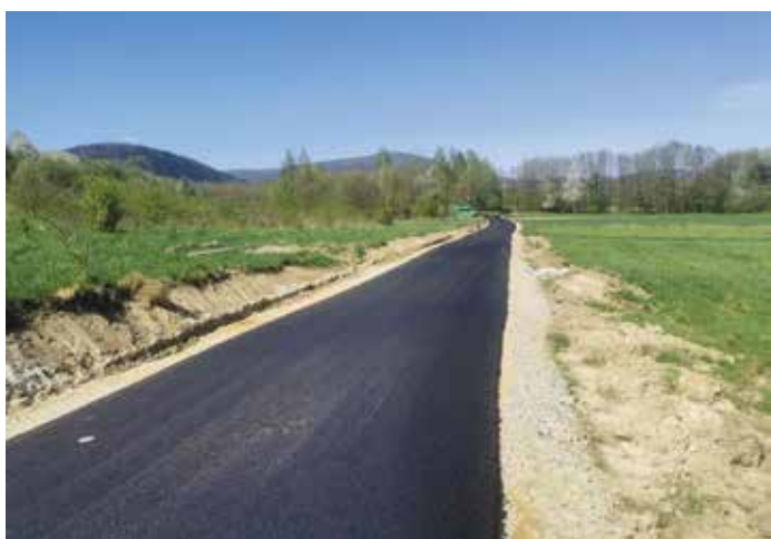
Radziechowy ul. Szkolna do Twardorzeczki