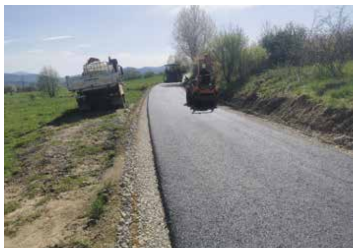
Radziechowy ul. Szkolna do Twardorzeczki