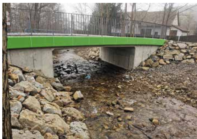
Most ul. Modzrewiowa Przybędza