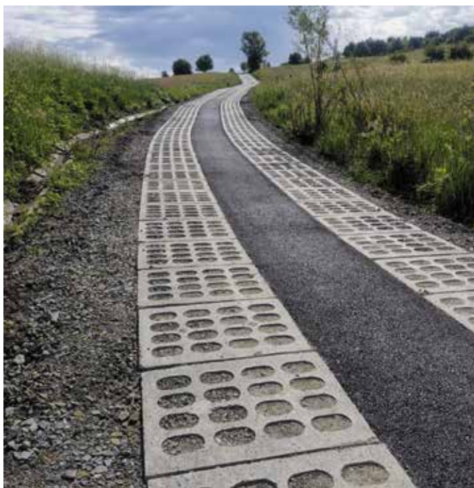
Wieprz ul. Bubrów