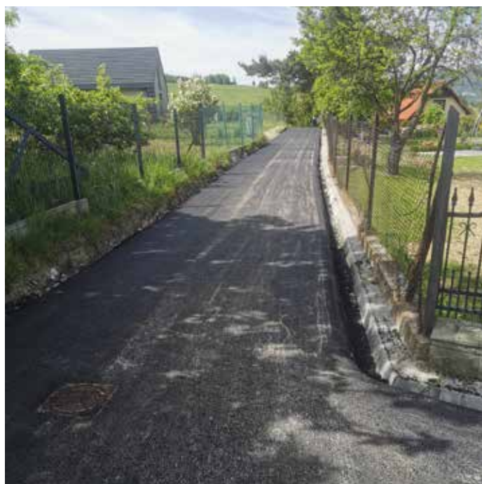
Brzuśnik Odnoga ul. Wierchowej