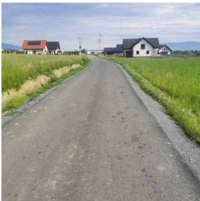
Radziechowy ul. Jasna