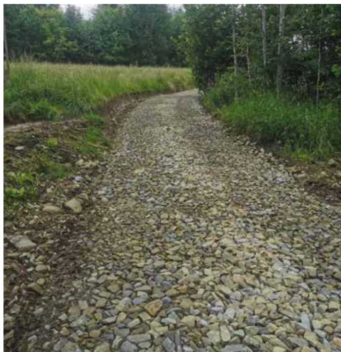
Radziechowy ul. Studzienna