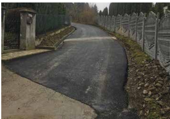
Brzuśnik Droga na Prawy Groń