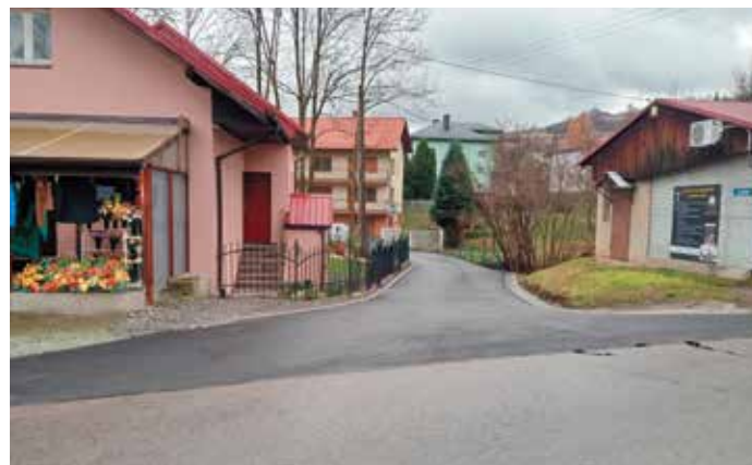
ul. Zakole Radziechowy