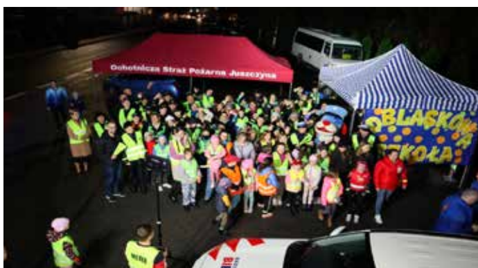
Pamiątkowe zdjęcie uczestników akcji „Świeć Przykładem”

Mody dla Seniora XXI w, szkolne konkursy na odblaskowy kostium dyskotekowy, i projekt znaczka odblaskowego. Nagraliśmy film i piosenkę, a do niej teledysk, których tematem przewodnim było zakładanie odblasków. Zorganizowaliśmy spotkanie z Seniorami z Klubu Wrzos, wolontariusze odwiedzili Urząd Gminy, w celu pozyskania partnerów w promowaniu naszych działań na rzecz poprawy bezpieczeństwa na drodze. Ponadto Szkolne Koło Teatralne przygotowało przedstawienie pt. „Szkoła”, którego przesłaniem było właściwe zachowanie się na drodze, w tym prawidłowe przejście przez jezdnię. Aktorzy zaprezentowali sztukę seniorom oraz całej społeczności szkolnej. Przygotowaliśmy ulotki, plakaty, prezentację multimedialną „W trosce o bezpieczeństwo mieszkańców Juszczyny”, z którymi staraliśmy się dotrzeć do jak największej grupy mieszkańców. Gościliśmy w szkole Funkcjonariuszy Policji, którzy prowadzili prelekcje i praktyczne ćwiczenia w Miasteczku Ruchu Drogowego. Nie sposób wymienić wszystkich działań, które podjęliśmy, bo było ich o wiele, wiele więcej. Zapraszamy na stronę internetową i Facebook szkoły.