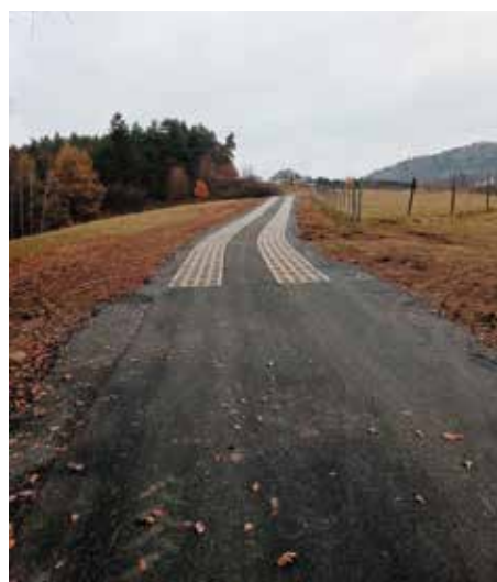
Droga do gruntów rolnych Juszczyna do Trzebini