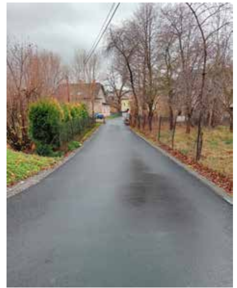
ul. Kasoni Radziechowy