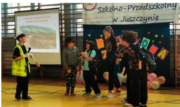
Scenka z przedstawienia teatralnego „Szkoła”