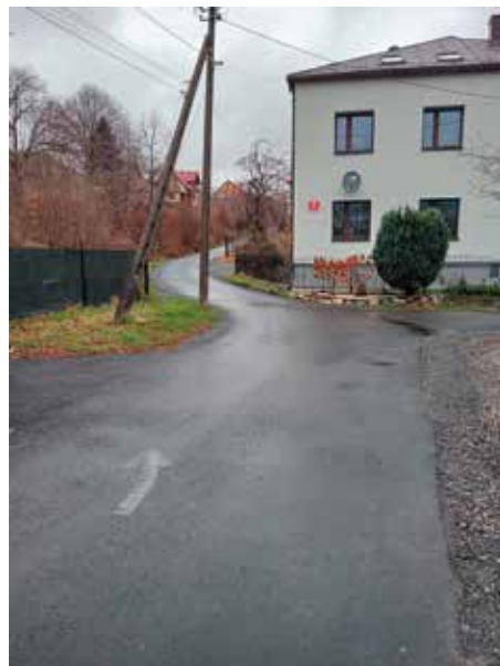
ul. Bukowa Radziechowy