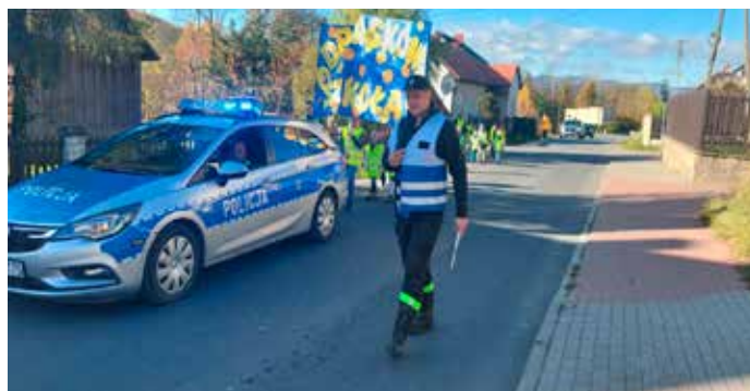
Przemarsz uczniów i nauczycieli pod eskortą policji i straży.