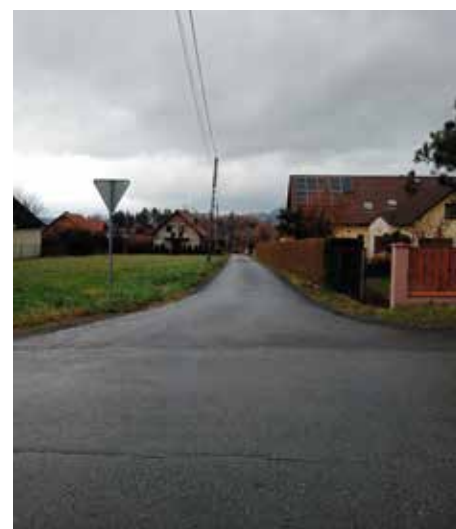
Droga do Machałów Brzuśnik