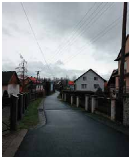
ul. Spacerowa Wieprz