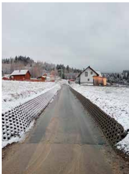
Droga Borek II Juszczyzna