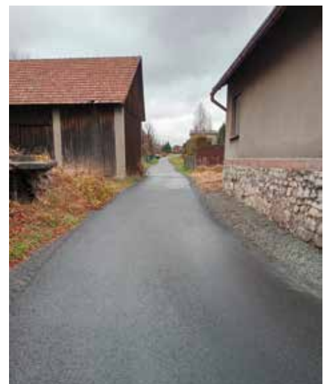
ul. Różana Radziechowy