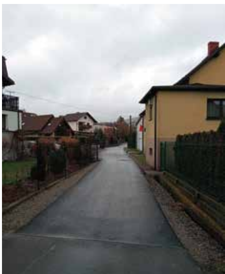
łącnik ul. Peków i Świniańskich