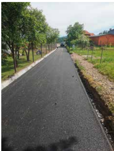
Brzuśnik Odnoga ul. Wierchowej