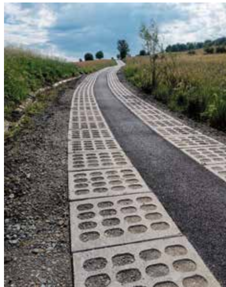
Wieprz ul. Bubrów