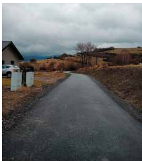
Droga do gruntów rolnych Kwiatowa Radziechowy do Przybędzy