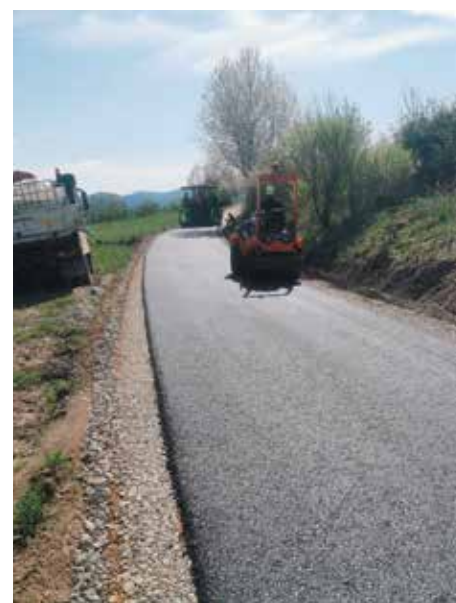
Radziechowy ul. Szkolna do Twardorzeczki