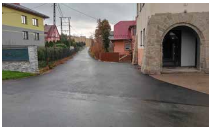
Droga nad Strażnicą Bystra

Gmina Radziechowy-Wieprz kontynuuje działania zmierzające do dalszej modernizacji infrastruktury drogowej, wychodząc naprzeciw potrzebom swoich mieszkańców i dbając o zrównoważony rozwój na całym podległym obszarze.