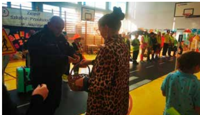
Spotkanie z Seniorami: Odblaskowy Pokaz Mody, wręczanie odblasków