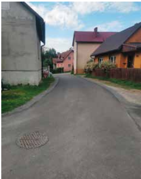
Radziechowy ul. Jasna