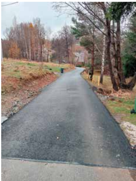
ul. Długa Przybędza