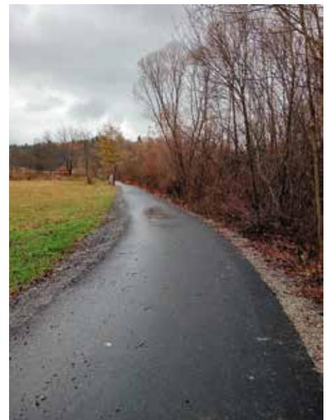
ul. Zagórczańska Wieprz